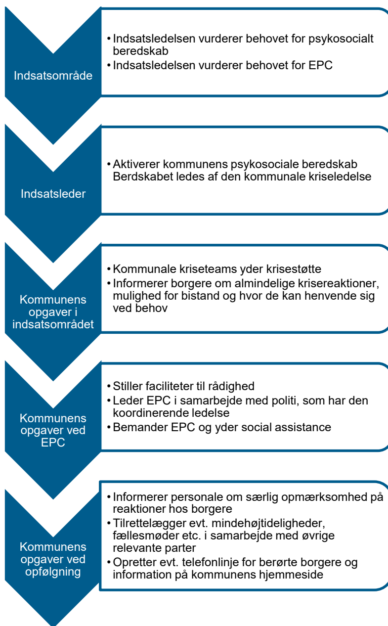
Figur 2: Aktivering af kommunens psykosociale beredskab, hvor regionen ikke er aktiveret