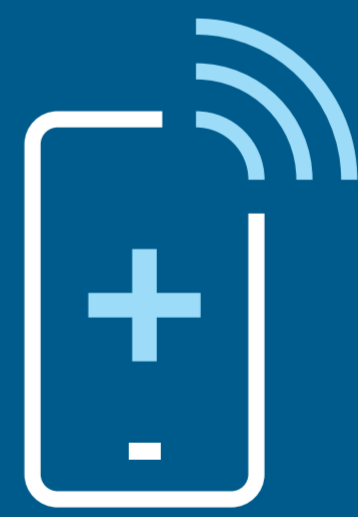
Ved behov for legehjelp må du ringe på forhånd. Ikke møt opp uten avtale

Les artikkelen vår på hjemmesiden sst.dk/covid-turist