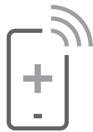
Ring först, innan du uppsöker läkarvård. Kom inte utan att ha bokat en tid

För mer information, läs vår broschyr på webbplatsen sst.dk/covid-turist