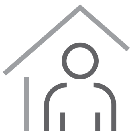
Gehen Sie in häusliche Isolierung