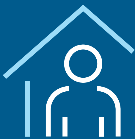
Gehen Sie in häusliche Isolierung