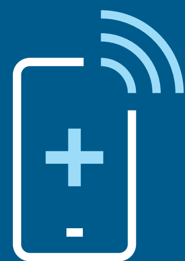
Wenn Sie ärztliche Hilfe benötigen, rufen Sie vorher an. Erscheinen Sie nicht ohne einen Termin

Mehr erfahren Sie in unserem Faltblatt auf der Website sst.dk/covid-turist