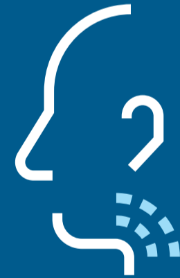
ናይ ጎረሮ ምቕሳል

ምሕማምካ እትጠራጠር እንተኾይካ ኣውን ኣብ ገዛኹ ክትጸንሕ ኣለካ ገዛእ ርእስኹ ክትፈሊን ንምርመራ ባዕልኹ ከተመቻቸኣ ኣለካ።