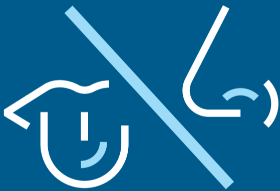
ናይ መቐረትን ናይ ምሽታትን ስምዒት ምጥፋእ