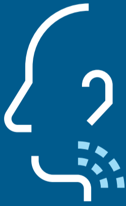
ألم في الحلق