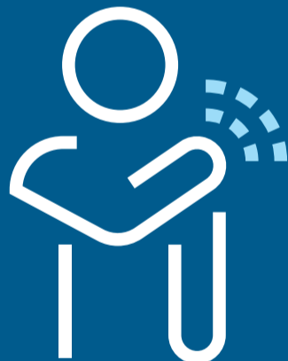
ألم في العضلات