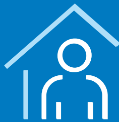
Bliv hjemme og bliv testet, hvis du får symptomer