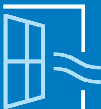
Luft ud og skab gennemtræk