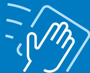
Gør rent, særligt på overflader som mange rører ved