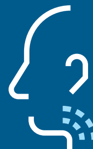
Ondt i halsen

Du skal blive hjemme indtil 48 timer efter, du ikke er syg mere.