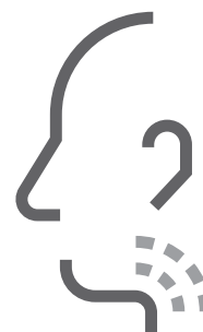
Ondt i halsen

Du skal blive hjemme indtil 48 timer efter, du ikke er syg mere.