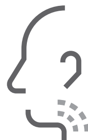
Ondt i halsen

Bliv også hjemme, hvis du er i tvivl, om du er syg. Gå i selvisolation og sørg for at blive testet.