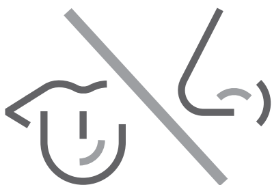
Tab af smags- og lugtesans