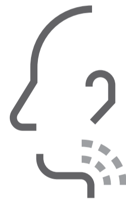
Ondt i halsen

Bliv også hjemme, hvis du er i tvivl, om du er syg. Gå i selvisolation og sørg for at blive testet.