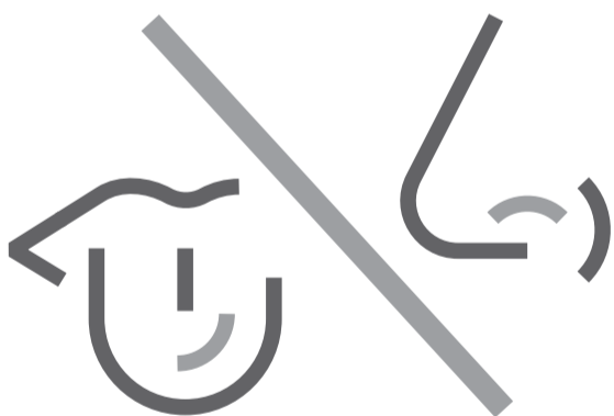
Tab af smags- og lugtesans