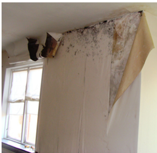
Omfattende fugtskade og skimmelsvampevækst

Sundhedsrisiko er ikke et veldefineret lægeligt begreb. I almindelighed bruges ordet risiko om sandsynligheden for, at en konkret udsættelse for noget sundhedsfarligt udløser helbredsproblemer. At der er en sundhedsrisiko ved udsættelse for fugt og skimmelsvampe betyder her, at fugt og skimmelsvampe med en vis sandsynlighed udløser helbredsskader.