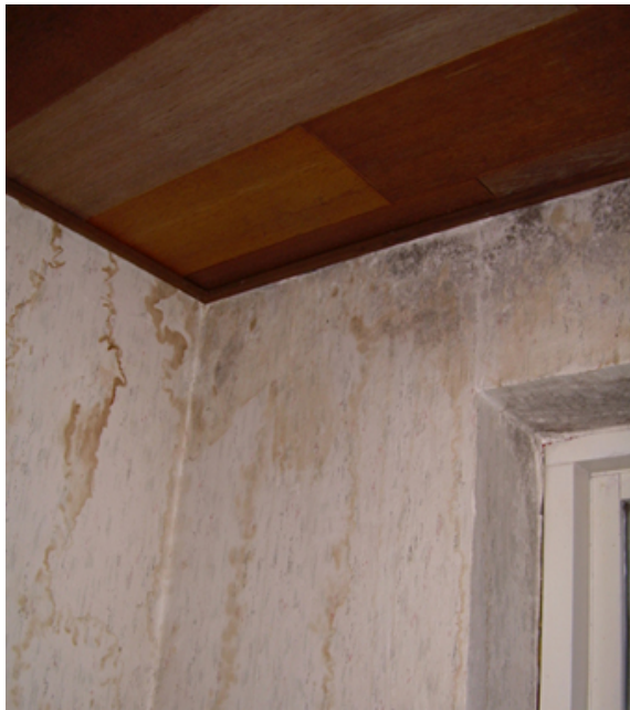
Omfattende fugtskader og skimmelsvampevækst