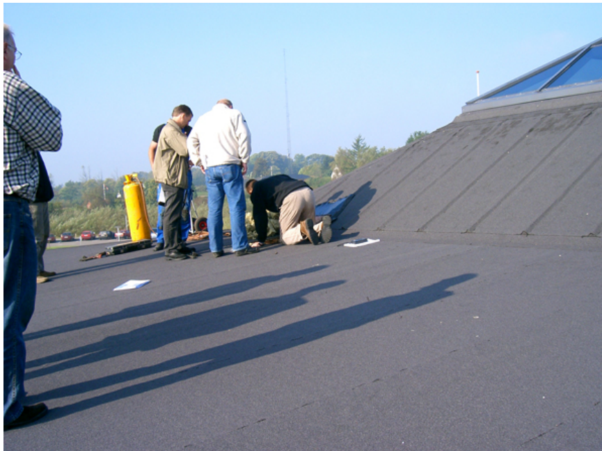
Forskellige aktører i færd med at undersøge skimmelsvampeskade.

Andre firmaer har særlig ekspertise vedrørende måling og artsbestemmelse mv. af skimmelsvampetyper.