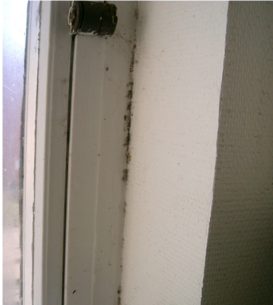
Kuldebro med fugt og skimmelvækst