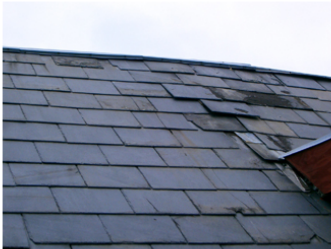
Manglende vedligeholdelse med vandindtrængen