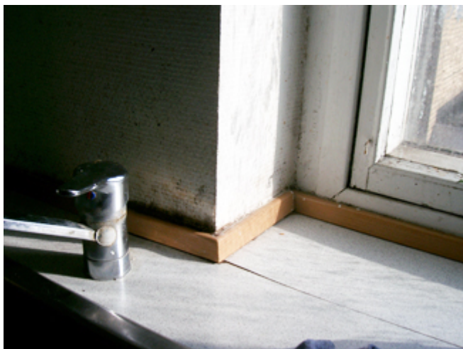
Fugt og skimmelsvampevækst i et køkken

Der kan ikke fastsættes en nedre grænse for, hvornår fugt/ skimmelsvampevækst kan være af sundhedsmæssig betydning, idet indeklimapåvirkningen vil afhænge af placering mv. Men lette angreb af skimmelsvamp i de yderste lag af klimaskærmen bag facadebeklædninger, på vindspærren og de yderste lag af tagkonstruktionen vil normalt ikke være af sundhedsmæssig betydning, forudsat at skimmelsvampesporer og evt. andre sundhedsskadelige faktorer mv. ikke kan føres via en luftstrøm til inde-luften. Kommunen foretager et konkret skøn i hvert enkelt tilfælde. Også her bør skaderne dog ud fra et forebyggelsesmæssigt synspunkt udbedres. Men der er ikke behov for sundhedsfaglig rådgivning.