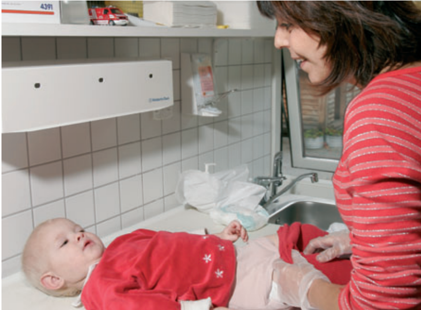
Der bruges engangshandsker ved bleskift. Puslemadrassen rengøres med denatureret ethanol.

Indretningen af håndvaskepladser er omtalt i afsnit 3.1.9.