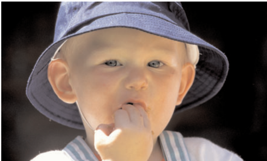
En solhat er med til at beskytte mod solen.

Forældrene bør opfordres til, at børn på solskinsdage fra forår til efterår er smurt ind på utildækket hud hjemmefra. Personalet i daginstitutioner bør kunne klare sig med 1-2 solcremer, som kan aftales på et forældremøde.