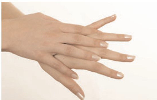
Håndryg og finger-mellemrum vaskes på begge hænder.