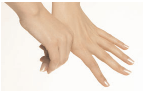
Tommelfingerens bagside vaskes på begge hænder.