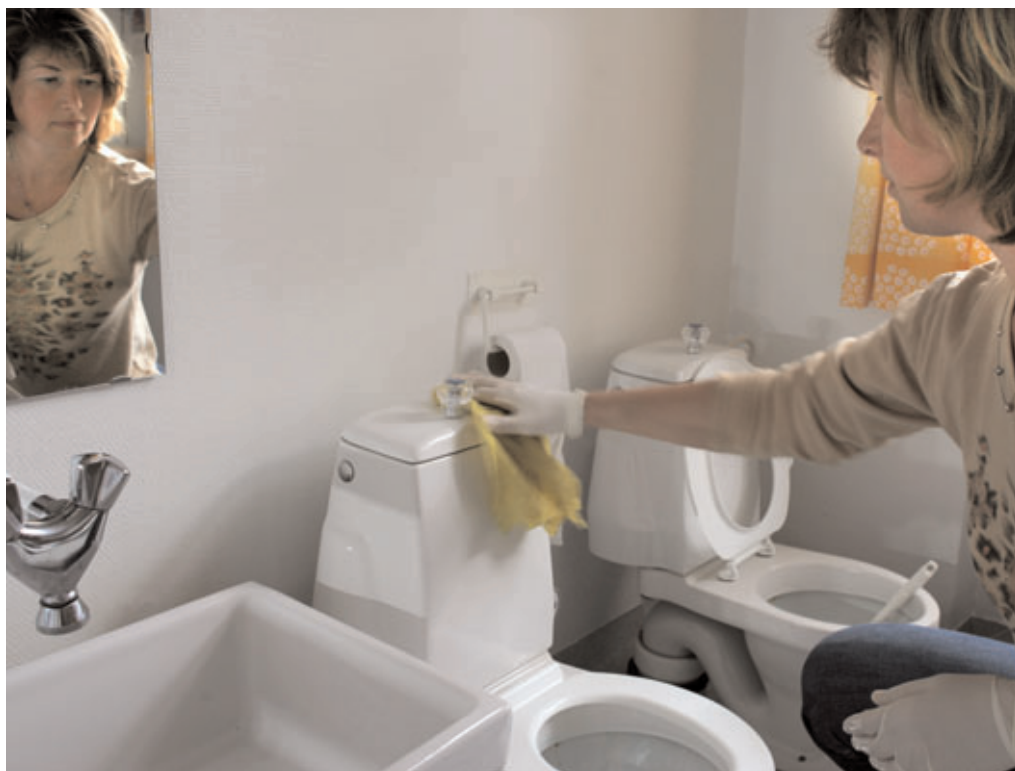
Måltrettet rengøring: Træk-og-slip-knappen forurenes af mange hænder.

OBS: Klorholdige rengøringsmidler må aldrig anvendes sammen med sure rengøringsmidler. Se også afsnit 6.7.