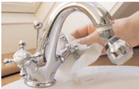
Vandhanen (urent område) lukkes med engangshåndklæde.