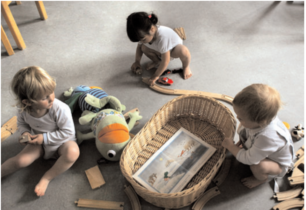
Leg foregår ofte på gulvet. Gulve skal være lette at rengøre.

Gulvbelægninger bør være fugefri eller have svejsede fuger. De skal kunne rengøres effektivt med fugtige rengøringsmetoder. Ved valg af gulvbelægning bør faren for at skride og for dannelse af statisk elektricitet være søgt undgået.