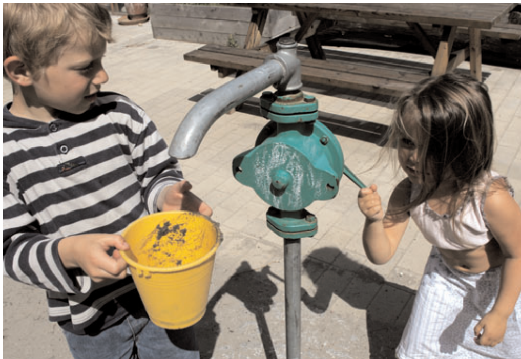
Vand til leg bør altid være af drikkevandskvalitet.

at børn indtager mere føde, drikker mere væske og indånder mere luft per kilo legemsvægt, end voksne gør. Børns indåndingszone befinder sig nærmere ved jordoverfladen end voksnes. Børn mangler desuden viden om betydningen af forurening. Beskyttelsen af børn må derfor være de voksnes ansvar fra fødslen. Herefter må den aftage frem imod voksenalderen igennem en proces, der gerne skal føre til, at barnet kan klare sig selv i en kompliceret verden.