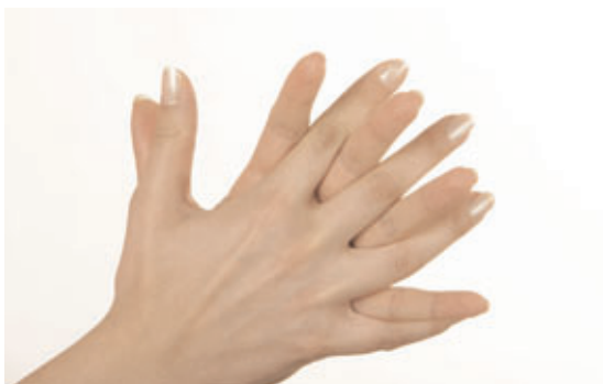
Håndfladerne vaskes med let flettede fingre.