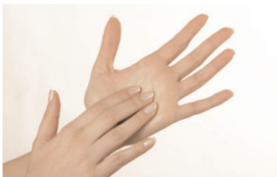
Håndfladernes furer vaskes på begge hænder.