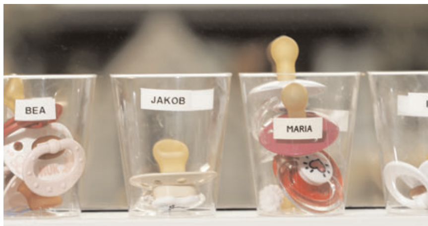
Børnenes sutter skal holdes adskilt under opbevaring.

Desinfektion af sutter og flasker omtales i afsnit 9.3.4.