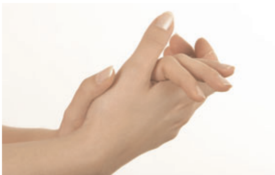
Hænderne gøres våde, og sæben fordeles.