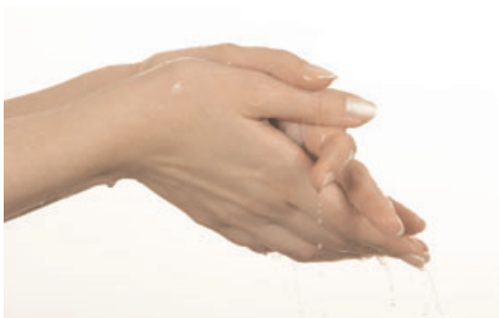
Sæberester skylles omhyggeligt af.