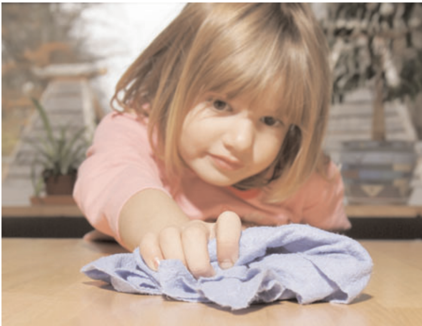
Børn kan inddrages i målrettet rengøring.

Målrettet rengøring retter sig imod rengøringsobjekter, hvorfra smitteoverførsel erfaringsmæssigt ofte forekommer, eller hvor tilsmudsning først og fremmest vides at foregå. Sådanne nøglepunkter findes i alle rum.