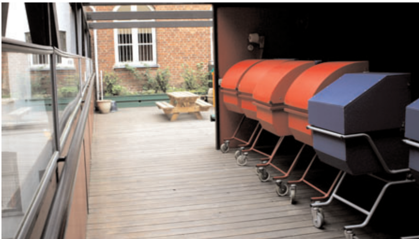
Barnevogne og krybber bør stilles under tag og i læ.